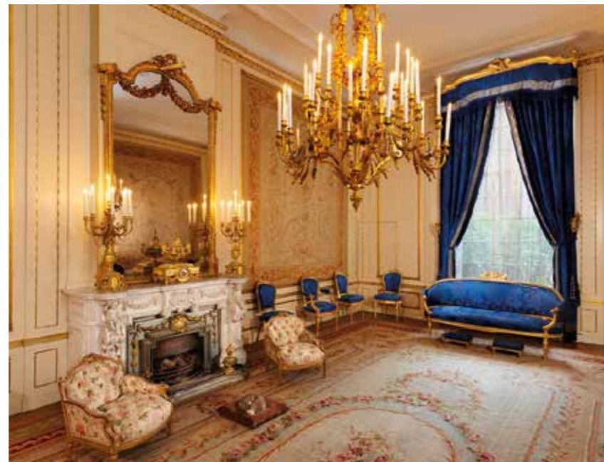
Onder: De balzaal van het huis.