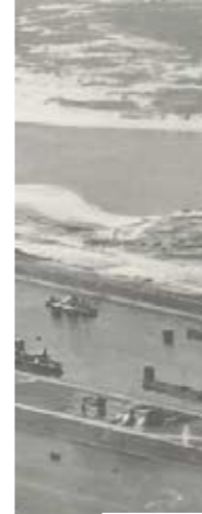
Luchtfoto uit 1919. (Crown Van Gelder)