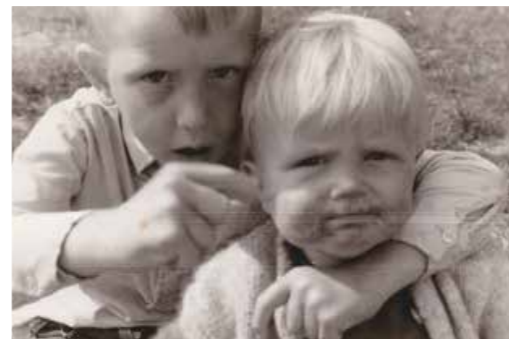
Verskillende momenten uit het leven van Hans Klok.

met goochelspullen, een ongelooflijke bende. Hans deed op die avond een nummer van drie minuten. Allemaal duiven in een kooitje, vervolgens een doek eroverheen, een steekvlam en daar zat opeens een kat in de ruimte. En dat ging allemaal met een vanzelfsprekendheid en een professionalisme. Ik dacht bij mezelf: dit is echt het prototype van een natuurtalent."