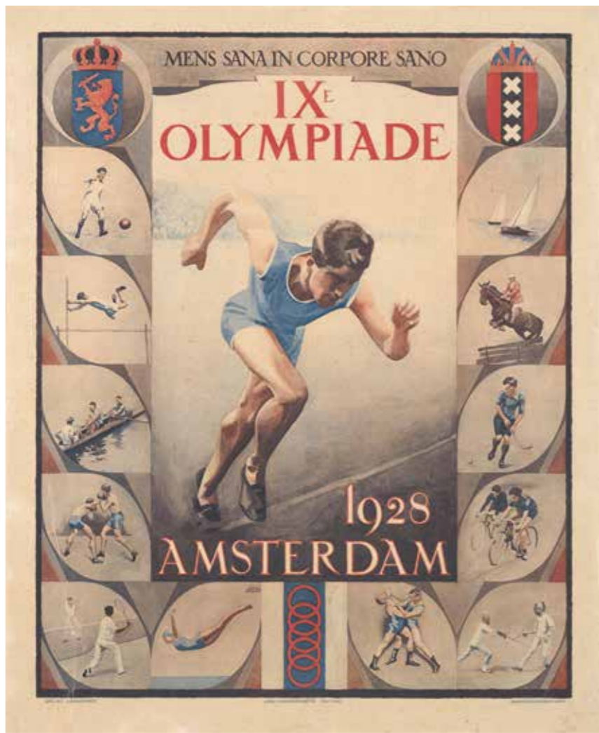
Boven: affiche van de Olympische Spelen in Amsterdam in 1928.